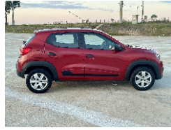
3 Lateral Derecho