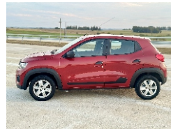
7 Lateral Izquierdo