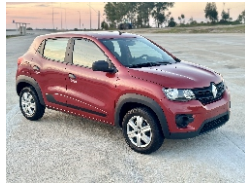
2 Frontal 45° Der.