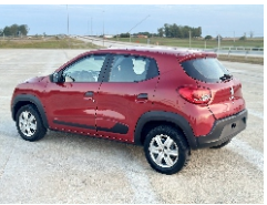
6 Trasera 45° Izq.